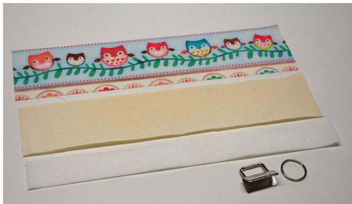
obr.19 Materiál připravený na látkovou klíčenku.

Poslední klíčenka, která nás čeká, je látková. Na ni máme připravený pás z látky o šířce 8cm a délce 30cm a dvě výztuhy - stejně dlouhý pás z Vefixu, který je na šířku o 2cm užší a 2cm proužek z Ronofixu.