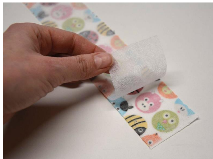
obr.10 Výztuhu nažehlíme na rubovou stranu látky. Já jsem použila k vyztužení Vliselín, ale doporučuji použít Vefix.

Látku vyztužíme z rubové strany Vefixem.