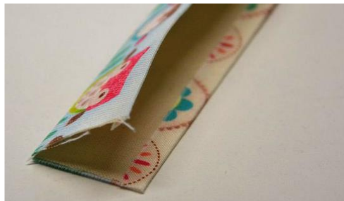
obr.22 Pásek složený podél delší strany na polovinu.

Pásek složíme podél delší strany přesně na polovinu a zažehlíme.