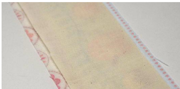
obr.20 Po obou stranách látky chybí 1cm výztuhy.

Na rub látky nažehlíme Vefix. Výztuha je o 2cm užší, a proto ji při nažehlování položíme na látku tak, aby na každé dlouhé straně chyběl přesně 1cm výztuhy.