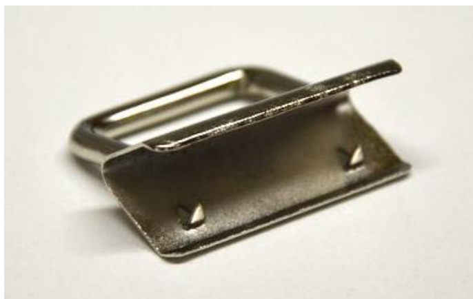
obr.7 Pohled dovnitř spony.

Sešité konce pásku vložte dovnitř spony a secvakněte kleštěmi k tomu určenými.