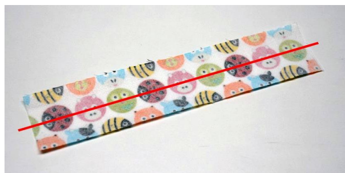
obr.11 Červeně je znázorněna linka, kterou si tužkou na vyztuženou látku narýsuje.

Na rubovou stranu látkového pásku, narýsuje linku, procházející jejím středem.