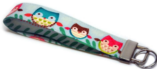
obr.24 Hotová látková klíčenka.

Pásek těsně při kraji sešijeme (cca 2mm od okraje). Šijeme vždy shora dolů, ale to už známe z předchozích klíčenek. Po sešití složíme pásek napůl a konce k sobě sešijeme cikcakem. Nasuneme kovovou koncovku a secvakneme. Poslední klíčenku máme taky hotovou.