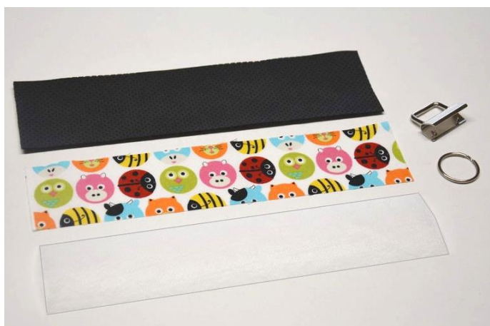
obr.9 Materiál připravený k výrobě klíčenky z koženky.

Na výrobu klíčenky z koženky budeme potřebovat pás koženky široký 6cm a dlouhý 30cm, látku o šířce 5cm a délce 30cm a výztuhu Vefix o stejných rozměrech jako je látka.