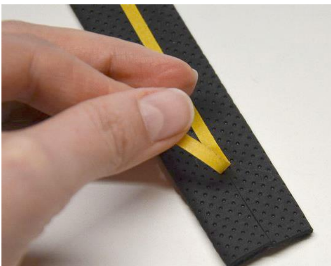
obr.15 Pásku nalepíme do středu koženkového pásku.

Aby bylo sešívání jednodušší, nalepte na koženkový pásek oboustrannou lepicí pásku (do míst, kde je spoj).