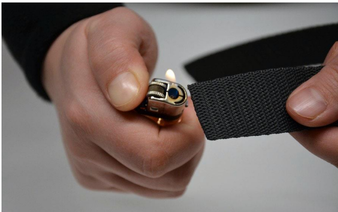
obr.2 Konce stuhy a popruhu zatavíme nad plamenem.

Aby se konce popruhu a stuhy netřepily, zatavíme je nad plamenem. Pokud šijete z bavlněného popruhu nebo z bavlněné stuhy, konce nezatavujte.