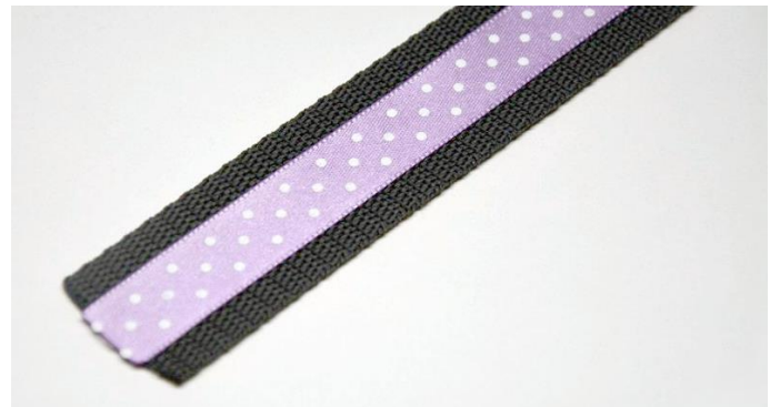
obr.4 Stuha nalepená na popruhu.

Z pásky sundáme ochranný papír a stuhu nalepíme na popruh. Jestli jí nalepíte do středu popruhu nebo ke kraji, je na vás. Já jsem lepila do středu.