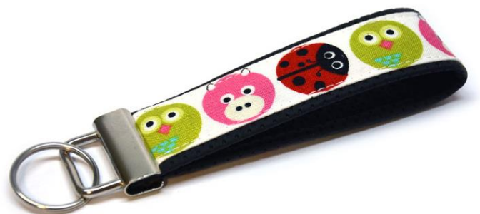
obr.18 Další klíčenku máme hotovou.

Dále postupujeme stejně jako u první klíčenky. Pásek složíme na polovinu a konce k sobě sešijeme cikcakem. Nasadíme kovovou koncovku, secvakneme a druhou klíčenku máme také hotovou.