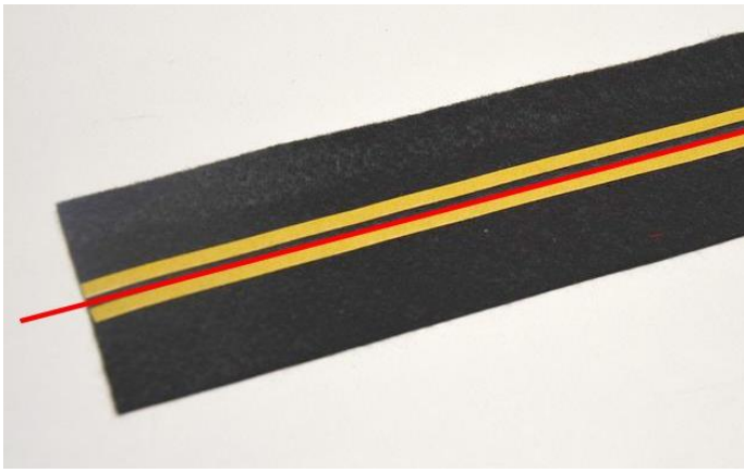
obr.13 Po obou stranách narysované linky nalepte oboustrannou lepicí pásku.

Oba dva pásy (z látky i z koženky) máme připravené a můžeme je k sobě sešít.