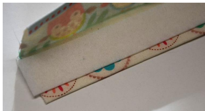
obr.23 Pásek Ronofixu vložíme dovnitř a zažehlíme.

Kdo by chtěl mít látkovou klíčenku pevnější, vloží dovnitř ještě úzký dvoucentimetrový pásek Ronofixu. Ten nažehlíme na jednu stranu klíčenky, přesně do středu. Protože je naše klíčenka široká 3cm a Ronofix pouze 2cm, bude na obou stranách scházet přesně 0,5cm výztuhy.