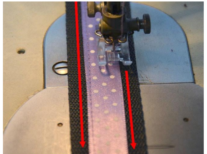
obr.5 Obě strany stuhy přišíváme vždy ve stejném směru.

Stuhu těsně při kraji přišíjeme (cca 2mm od jejího okraje). Stuhu DOPORUČUJI přišívat vždy jedním směrem. V opačném případě by se vám mohlo stát, že se popruh stočí do vrtule.