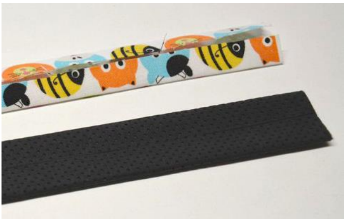
obr.14 Pásy připravené k sešití.

Oba dva pásy (z látky i z koženky) máme připravené a můžeme je k sobě sešít.