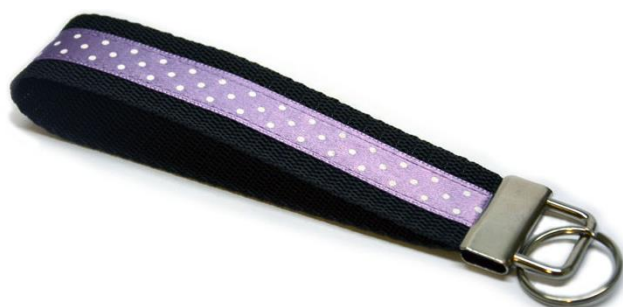
obr.8 Hotová klíčenka

Sešité konce pásku vložte dovnitř spony a secvakněte kleštěmi k tomu určenými.