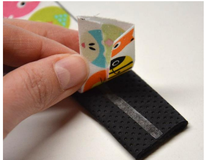
obr.16 Pásy k sobě slepíme.

Ochranný papír z pásky sundáme a na koženkový pásek přilepíme pásek látkový. Pásy na sebe pokládáme tak, že nezačištěné okraje na obou páscích budou po slepení schované uvnitř.