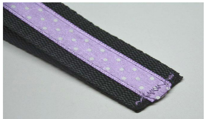
obr.6 Konce klíčenkového pásku jsem k sobě sešila cikcakem.

Takto připravený klíčenkový pásek složíme na polovinu a konce k sobě sešijeme.