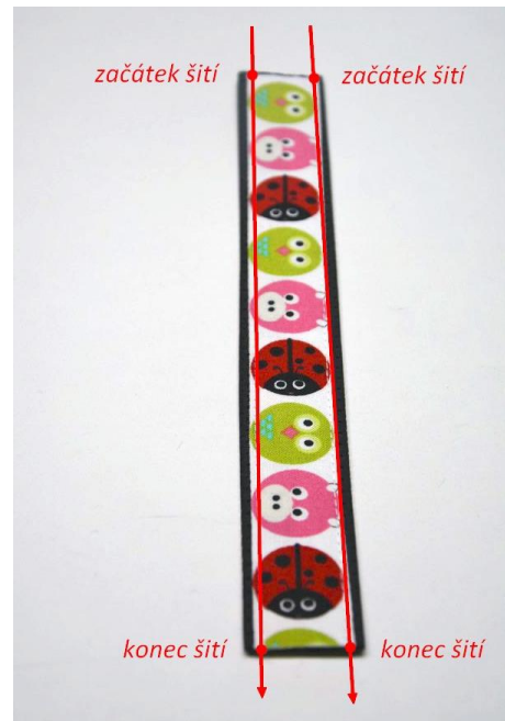
obr.17 Látku ke koženke při kraji přišijeme.

Látku ke koženke přišijeme těsně při kraji (cca 2mm od okraje látky), nejdříve z jedné strany, poté z druhé. Postupujeme stejně jako při přišívání stuhy na popruh.