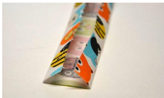
obr.12 Nezačištěné okraje pásku přehneme k narýsované lince.

K narýsované lince přehneme nezačištěné okraje látky a žehličkou zažehlíme.