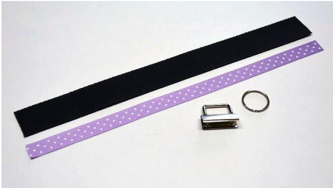
obr.1 Polypropylenový popruh a stuha o délce 30cm.

Připravíme si popruh dlouhý 30cm a stejně dlouhou stuhu.