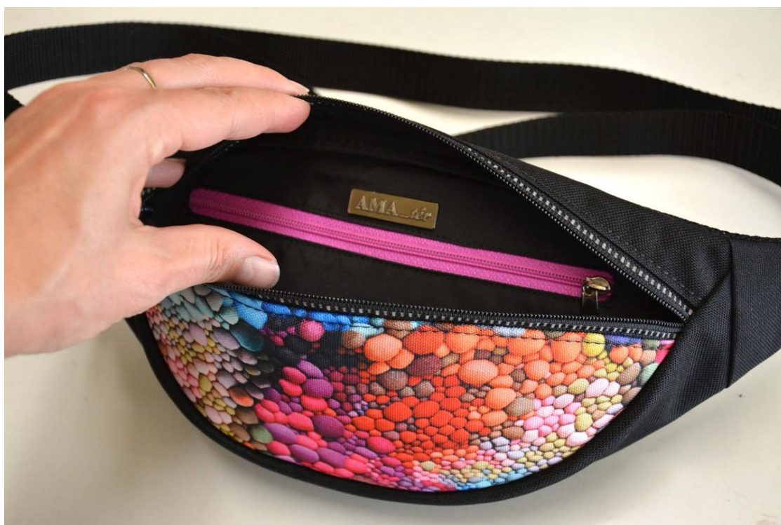
Zipová kapsa uvnitř ledvinky.

3) Třetí změnou je zipová kapsa uvnitř ledvinky. Dovnitř jsem na zadní stranu podšívky našila zipovou kapsu. Postup na šití této kapsy najdete ve Sborníku RAD & TIPŮ. Umístěná je 4,5cm pod horním okrajem zadního dílu a dlouhou ji mám cca 17cm.